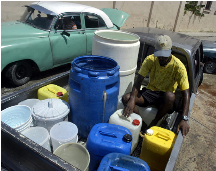
Decenas de miles de cubanos quedaron sin agua y sin luz en las zonas afectadas por el paso del huracán Charley, que el 13 agosto azotó el occidente de la isla.

nos y reformas políticas son ahora componentes críticos del descontento popular” 12 .