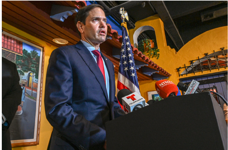
El senador republicano Marco Rubio habla durante una conferencia de prensa en Miami, Florida (EE.UU.).

nudo a costa de la nutrición y la calidad de vida”. 22