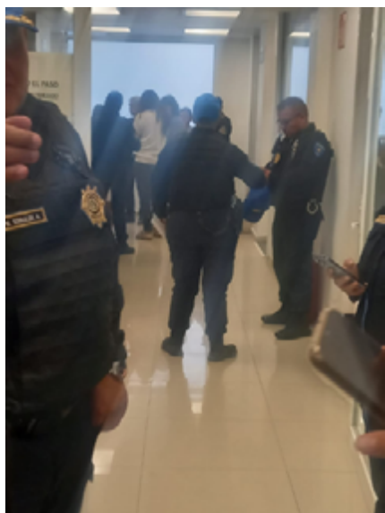
Primera imagen compartida con la Red TDT a las 17:35 donde se confirmó la presencia de las personas detenidas en Tlalpan.

Por varias horas, no se tuvo conocimiento del paradero de las y los detenidos, y se les mantuvo incomunicados. Tampoco fueron ingresados al Sistema del Registro Nacional de Detenciones 20 en las primeras horas de su detención. Al no formar parte del Registro por varias horas, al estar incomunicados y sin representación legal, así como al haberles trasladado de las instalaciones originales de la FGJ en Xochimilco, estas cinco personas estuvieron efectivamente desaparecidas por las autoridades.