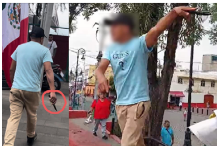
Sujetos armados: Capturas de pantalla de videos recopilados en línea 11

FRENTE POR LA LIBERTAD DE EXPRESIÓN Y LA PROTESTA SOCIAL