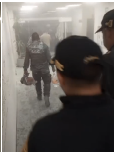
Captura de video tomado por ARTICLE 19.

Fotografías del operativo de la SSC de expulsión de manifestantes de la FGJ.