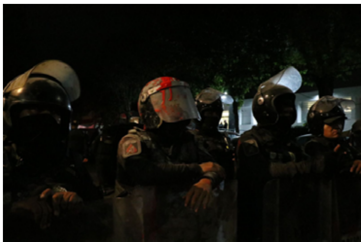
Operativo Policial afuera de la FGJ Tlalpan.

FRENTE POR LA LIBERTAD DE EXPRESIÓN Y LA PROTESTA SOCIAL