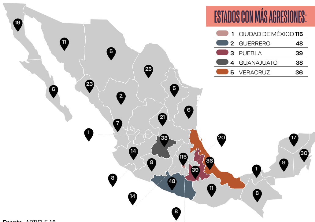
Gráfico 5: Agresiones por entidad federativa en México durante 2023

→ Veracruz: Se consolidó como el quinto estado más violento para periodistas con 36 agresiones contra la prensa (6%). Resaltan los ataques físicos 18 y que aquí se registraron 3 de los seis casos de desplazamiento interno documentados en el año. Como se presentó en la investigación “Veracruz de los Silencios” 19 , la entidad se mantiene como una de las más peligrosas contra periodistas y medios de comunicación. De hecho, se ha mantenido así desde el año 2009, como uno de los diez estados con mayores índices de violencia contra la prensa en México.